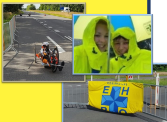
European Handbike Competition